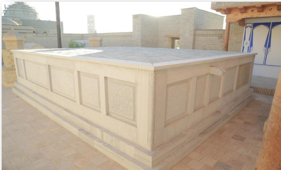
A.G‘ijduvoniylar xaziralaridagi dahma. 2026-yil.