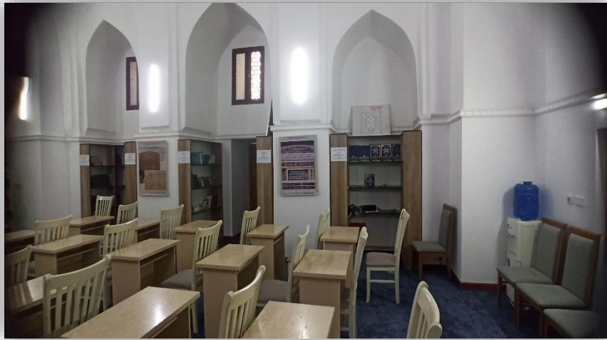
Madrasa kutubxonasi 2026-yil

Hozirda madrasaning darsxonasida Buxoro muzeyining filiali, masjidida — kutubxona o'z faoliyatini yuritib kelmoqda.