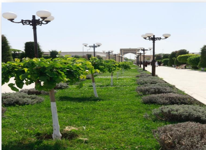
Majmua hududidagi bog‘. 2026-yil.